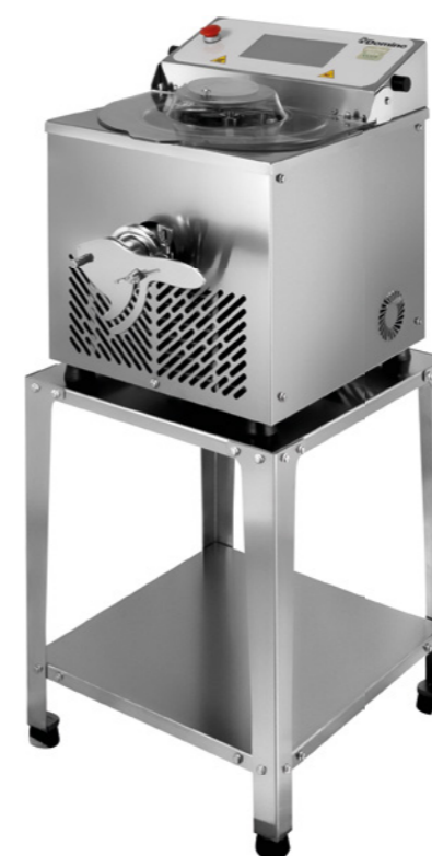
MAMA 8 TOUCH CON SUPPORTO MAMA 8 TOUCH WITH BASE

MAMA is the liquid natural yeast fermenter designed just for you: discover the model best suited to your production needs and let yourself be transported into the world of MAMALIEV liquid sourdough.